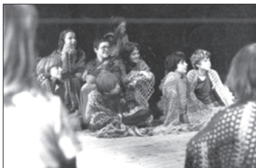
Obrázky z představení:

Bleděmodrý Petr (1974), Zahrada (1970) a Jak šumí les.