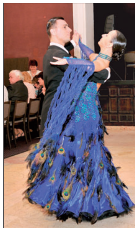
1. Společenský ples důchodců se velmi vydařil.