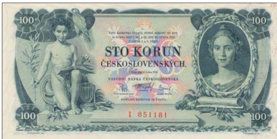
Stokoruna Maxe Švabinského z r. 1931

Přes mnohé bouřlivé diskuze byla v r. 1989 prosazena transformace měnové reformy politiky na principech demokracie a liberalismu. Ke změnám v oblasti peněžnictví a bankovního sektoru došlo po zániku československé federace (k 31. 12. 1992). Dnem 1. ledna 1993 vznikla Česká republika a byly založeny dvě samostatné centrální banky: Česká národní banka (ČNB) a Národní banka Slovenská. Cílem ČNB je péče o cenovou a finanční stabilitu, o bezpečné fungování finančního systému ČR, výkon a dohled nad osobami působícími na finančním trhu a vydávání bankovek a mincí, řízení peněžního oběhu a zúčtování bank. Nedělitelnou součástí fungování ČNB je program mezinárodní spolupráce a pomoci, zejména v rámci EU. S ohledem na ztrátu státní mincovny v Kremnici se ražba prvních mincí uskutečnila v německém Hamburku a kanadském Winipeg. Až v polovině r. 1993 byla otevřena tuzemská Česká mincovna v Jablonci nad Nisou. Po rozpadu česko-