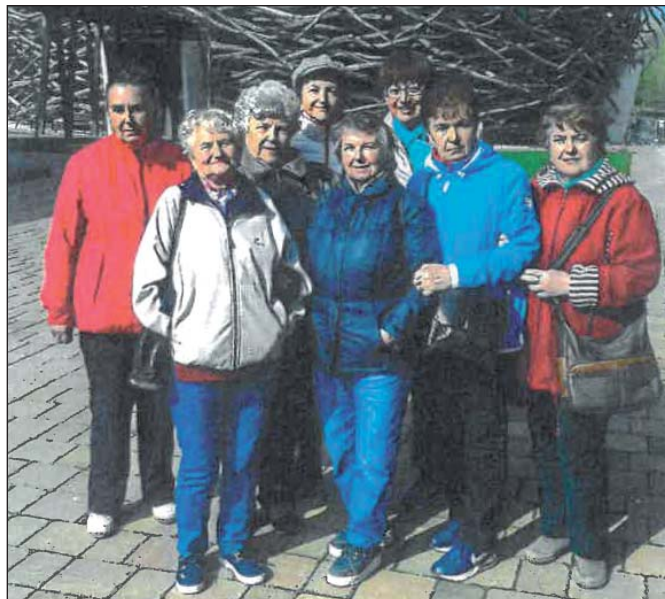
Zájezd na Čapí hnízdo

Vyzuly. Škoda, že se neuskutečnila slíbená prohlídka Poslanecké sněmovny a senátu v Praze.