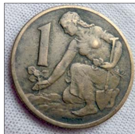
Mari Uchytílová-Kučerová - 1 Kčs mince s klečící ženou sázející lipovou ratolest

Dovolte, abych naše čtenáře pozvala na výstavu k problematice historie peněz v českých zemích včetně rakousko-uherské měny. Výstava, která nese název „Lidé a peníze“ se