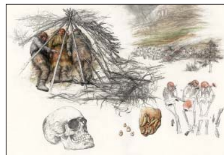
Ukázky z tvorby