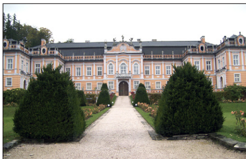
Záříjový výlet Svazu důchodců na hrad Svojanov (vpravo) a Nové Hrady.

„V zásadě není jiná cesta: Je to cesta přes demokracii, lidská práva a samozřejmě občanskou společnost, protože podle mého soudu, občanská společnost je nejlepší prostředek, jak zabránit tomu, aby osudy lidí a národů nebyly v rukou úzkých mocenských elit.“