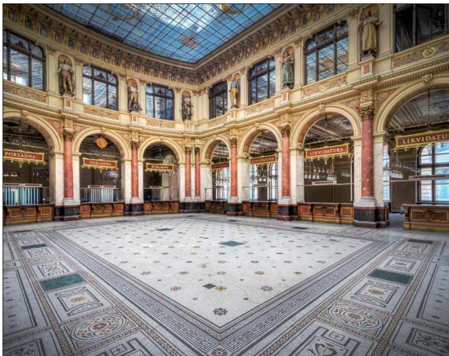
Interiér Živnostenské banky v Praze

Po vypuknutí 2. světové války nastala pro český národ druhá „doba temna“. V mezinárodním měřítku se přestaly dodržovat veškeré dohody a smlouvy. Nebyla respektována žádná lidská práva a svobody, docházelo ke ztrátám na majetku, ničení kulturních hodnot a nakonec i velkým ztrátám na životech. Ve finanční oblasti byla zavedena protektorátní měna a přešlo se na tzv. přidělový systém (potravinové lístky, šatenky atd.). Kvůli nedostatku potravin i léků se využívala i nabídka Mezinárodního červeného kříže (UNRA). V roce 1940 byl zaveden tzv. matrikulární příspěvek, který musela protektorátní vláda odvádět říšskému ministerstvu financí jako „příspěvek na německé válečné výdaje“.