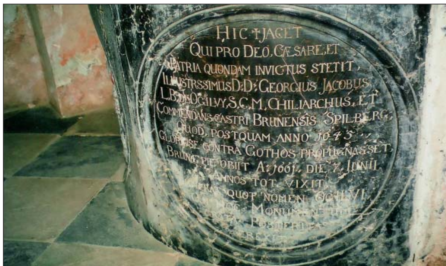
Náhrobek v klášterním kostele svatých Petra a Pavla v Rajhradě.