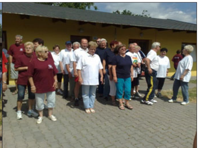
V Hodoníně na startu.