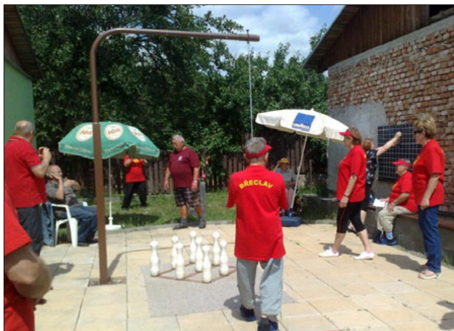
Kuželkáři v akci.