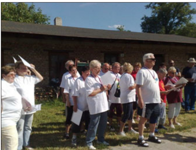
Kuželkáři - druhé mužstvo zleva Brňáci.