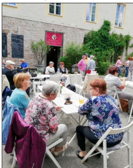
Posezení v přírodě dne 25. 5. 2023 Na Síteláka