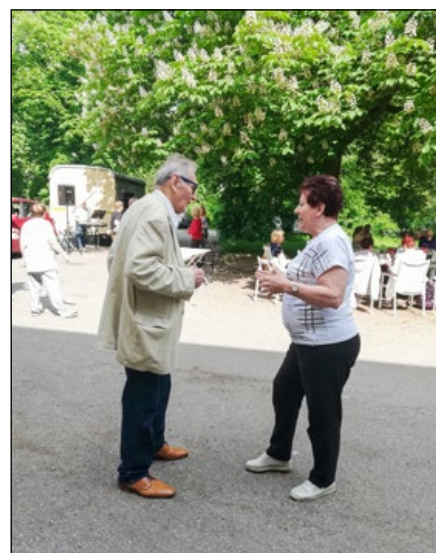
Den matek dne 19. 5. 2023 na Nové radnici