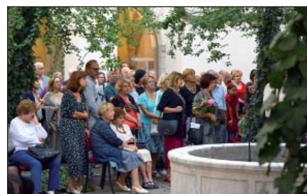
Vernisáž Quinquaginta, 6. 9. 2018