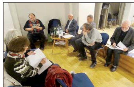
Diskuse na valné hromadě Sdružení Q na JAMU, říjen 2017