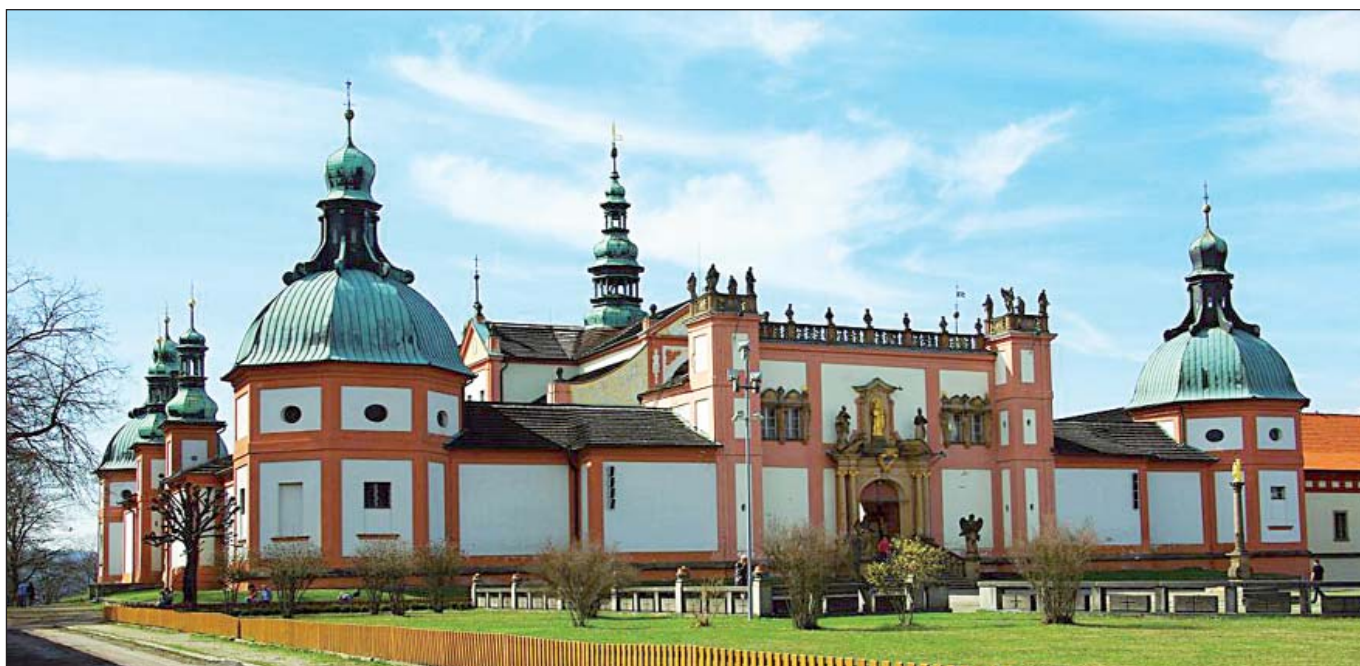
SVATÁ HORA U PŘÍBRAMI